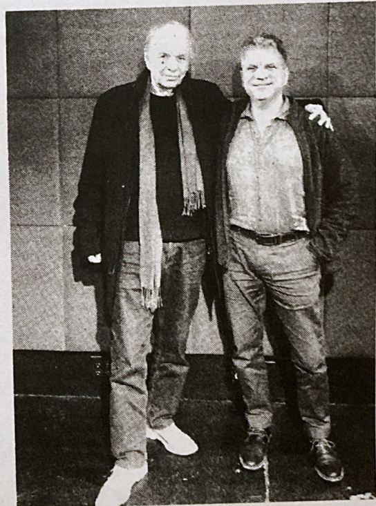
Με τον σημαντικό κιθαρίστα Ralph Towner.

Είναι η πρώτη φορά που μελοποιήσατε αστυνομικό στίχο με