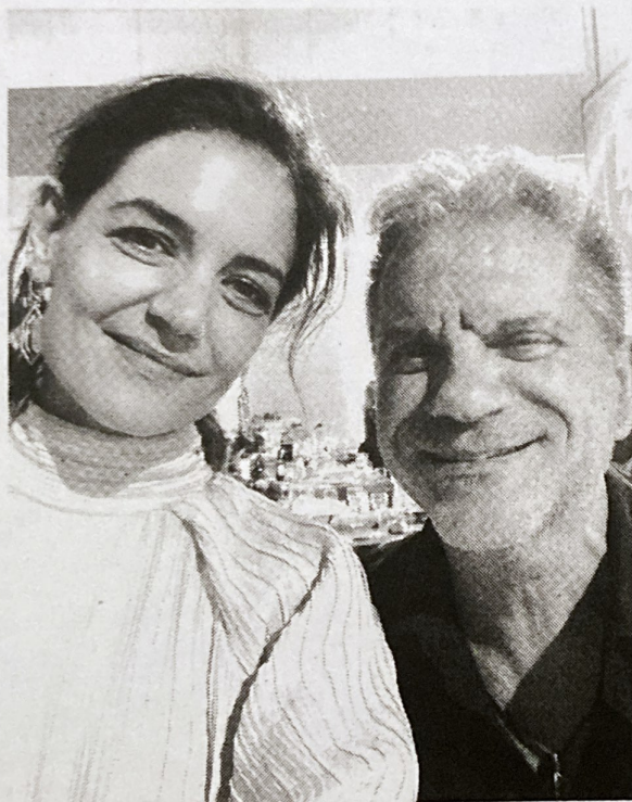
Ο Σπύρος με τη σκηνοθέτρια και ηθοποιό του Χόλιγουντ Katie Holmes, μετά από παράσταση του Σπύρου προς τιμήν του David Byrne, αρχηγού του ροκ συγκροτήματος Talking Heads.

Γιατί φύγατε από την Ελλάδα; Δεκαεφτά χρονών ήρθα στο Νιτρώι, για ένα χρόνο, στα πλαίσια ενός προγράμματος διεθνών ανταλλαγών, με μαθητές απ' όλο τον κόσμο. Αυτά η χρονιά ήταν καθοριστικά για μένα. Επαθα πολιτιστικό σοκ. Η διαφορά επιπέδου ζωής φάνηκε με το που πάτησα το πόδι μου, από τα αυτοκίνητα και τα σπίτια της μεσοκλάσης τάξης, μέχρι τα σχολεία και τα πάρκα της γειτονιάς. Το δημόσιο λύκειο στο οποίο φοίτησα διέθετε καλυμπτήριο, αίθουσα συνταξιούχων, θεατρικό θέατρο, χορωδία,