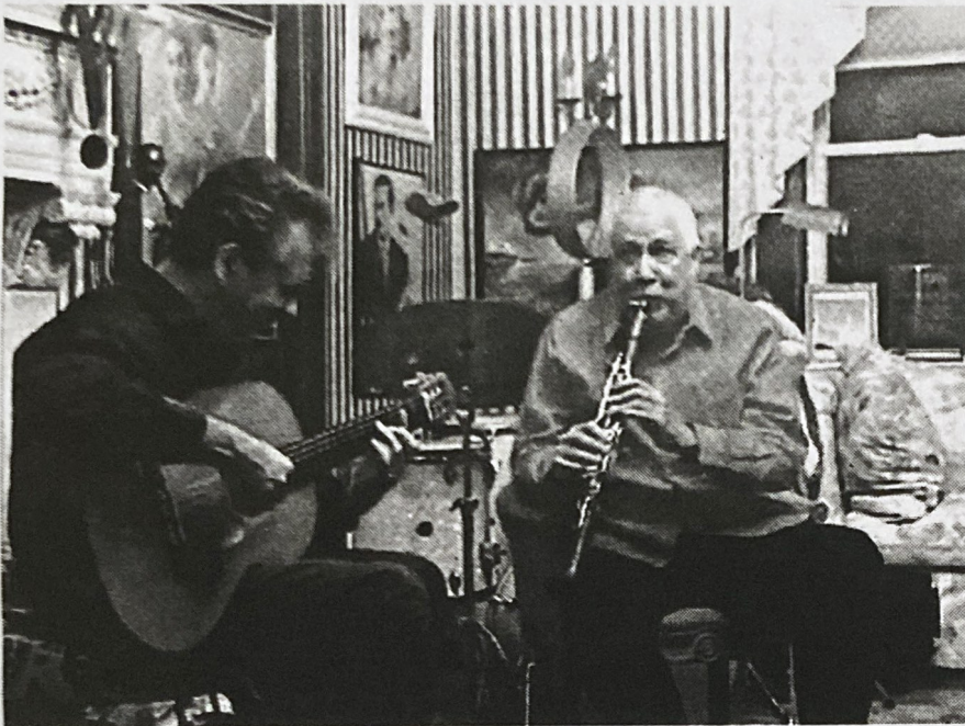
Με τον 6 φορές βραβευμένο με Grammy, Paquito D'Rivera.

αναφορά στο έγκλημα. Πόσο διαφορετικά είναι αυτή η δουλειά σας από τις άλλες, δεδομένου ότι χρησιμοποιήσατε περισσότερο ηλεκτρικό ήχο;