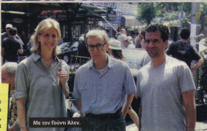
Με τον Γούντι Άλεν.